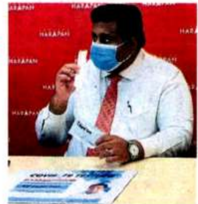
■拉吉夫：政府必須採取更明確的抗疫策略。

透过RT-PCR还是RTK-Ag，除了在mysejahtera上公布外，是否也必须让患者向CAC报告。