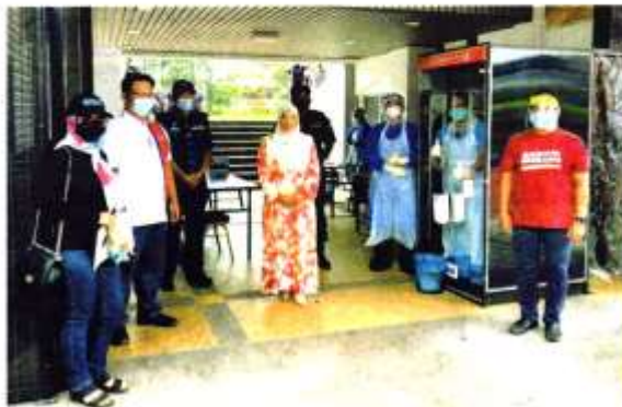
MBSJ menghargai komitmen petugas barisan hadapan mereka.