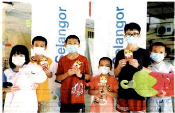
SESAHAGIAN kanak-kanak yang menerima sumbangan hadiah daripada Air Selangor bersempera sambutan Tahun Baru Cina baru-baru ini.

"Bagi 70 orang kanak-kanak kurang bernasib baik yang mendiami rumah perlindungan di Rainbow Home di Taman Fern Grove dan Pertubuhan Rumah Anak Yatim Berkat Kasih pula, mereka menerima sumbangan barangan makanan untuk dimasak semasa hari perayaan, barangan pembelajaran serta perabot baharu seperti sofa dan almari," katanya.