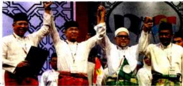
Hubungan UMNO dan Pas dalam koalisi Muafakat Nasional (MN) didakwa semakin rapuh susulan Pas dilihat lebih cenderung bersama Perikatan Nasional (PN).