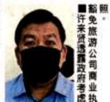
豁免。許來賢透露政府考慮