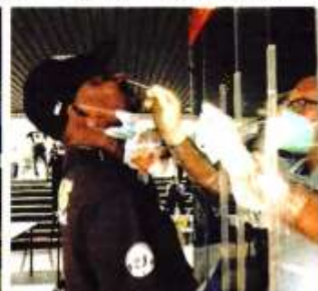
PROSES mengambil sampel ujian saringan Covid-19 menggunakan COMBAT FLEX.