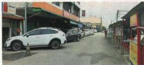
农村天公诞年前传统年货市集，也让当地烟火气大减。