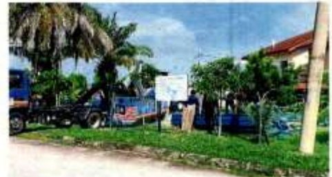
MPS enforcement officers removing the community hall structure following the demolition on Feb 9.

MPS did not comment on the matter as at press time.