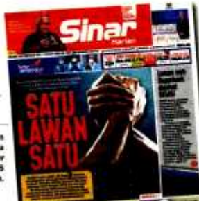
Keratan muka depan Sinar Harian 16 Feb.

Selain itu, beliau mengakui UMNO sukar untuk menang PRU15 sekiranya bergerak sendiri dan dijangka hanya mampu memperoleh 90 kerusi Parlimen.