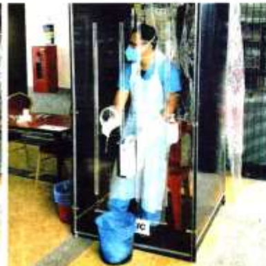
COMBAT FLEX inovasi ruang penghadang mudah alih yang ringkas dan selamat tanpa interaksi terus.

Inovasi ini hanya mengambil masa 10 minit dan petugas kesihatan tidak perlu menggunakan peralatan pelindungan diri (PPE) bagi mendapatkan sampel pesakit AZFARIZAL