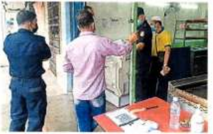
■安邦再也市议员执法人员正在协助制册，仍到多个地区面谈和执法。

他们指出，地方政府暂时没有编制要以治疗中病例作为标准。西公众意见社区出现确诊病例市议员。 他们指出，地方政府会安排独立组，获取新冠卫生官员即时处理态度，如果接获公众举报有违法反标准作业程序，会上门调查。 “地方政府将会为一套公共场所进行消毒，防范于未然。”