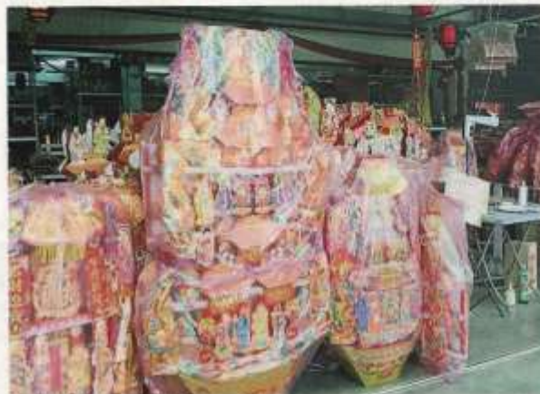
天公诞是拜天公不可或缺的供品。

且她还说初九离有几天，但已有不少当地人开始筹备年货商品，包括各种神料，和成数在大卖场等商家买者订购鲜花、水果及糕点等。