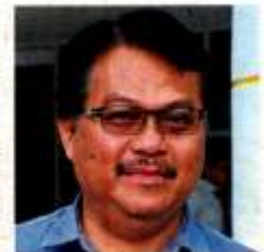
Zamri says the council will prioritise road repairs in Pandamaran based on safety issues.

must have more durable surface standards compared to roads located on strong sub-grades, where the need for strengthening layers was reduced, he said.