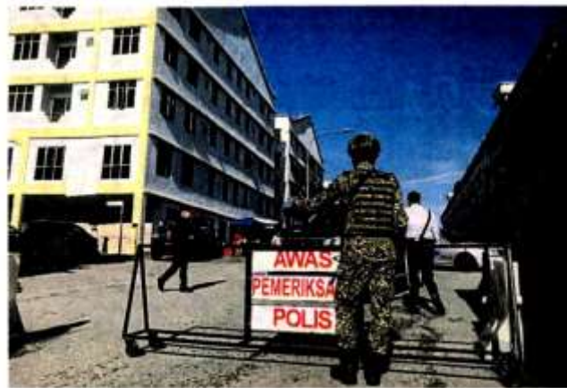
管制。流古路车站商业中心去年因疫情严重曾被加强