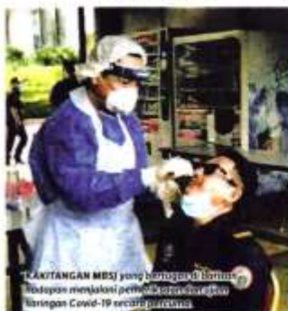
KAKITANGAN MBSJ yang berdehah berdehah selepas menjalani pemeriksaan kesihatan saringan Covid-19 secara percuma.

petugas kesihatan (HCW) dan proses mengambil sampel (swabbing) tidak terganggu. "Inovasi ini hanya mengambil tempoh masa 10 minit dan petugas kesihatan tidak perlu menggunakan peralatan pelindungan diri (PPE) bagi mendapatkan sampel pesakit. "Ia boleh digunakan secara langsung di mana sahaja," katanya.