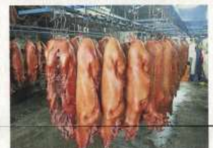
由于受到疫情影响，在沒有祭祀、神廟等大型活动支持下，也让烧肉销量大增。

我们天公座多为进口商品，因为本地缺乏制作工艺，今年也出现价格下降的情况，不过，我们还是保持价格稳定，尽量不提高价格。