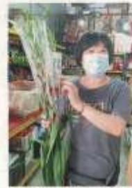
陈美婷：拜天公诞也叫天公花，是福耀人必备的供品之一。

作为长寿好兆头的甜柑，也是福耀人拜神的重要供品，此外，为了方便拜神，人们都会选购已煮熟并拌好红鸡蛋等，总之祭拜拜天公用品可能很多，应有尽有。