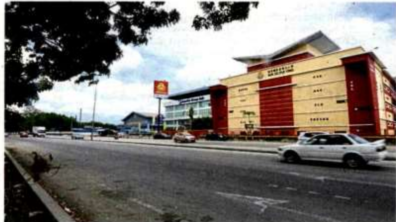
Devadass says pupils, workers and people who live in the area risk their lives when trying to cross Jalan Kapar during peak hours. (Right) JKR contractors have begun the earthworks for construction of the overhead pedestrian bridge at Mile 4, next to SJK (C) Pui Ying.