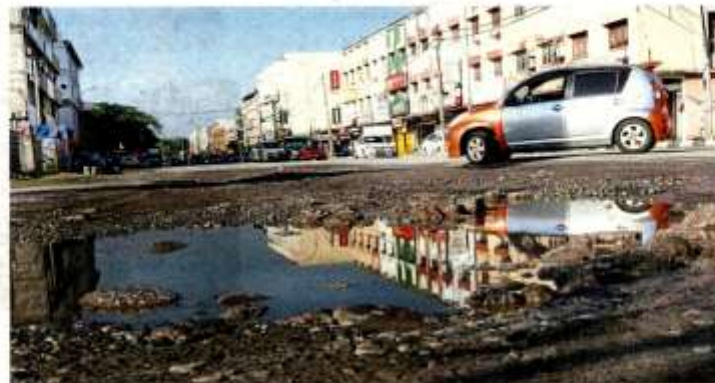
There are many potholes along Jalan Tengku Badar in Port Klang.