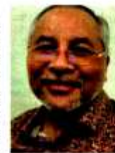
MOHAMAD KHIR TOYO

Terdahulu, ramalan dibuat institusi kajian politik, O2 Research Malaysia menjangkakan gabungan PN, BN, Pas;